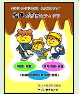
指導と評価のアイデア集